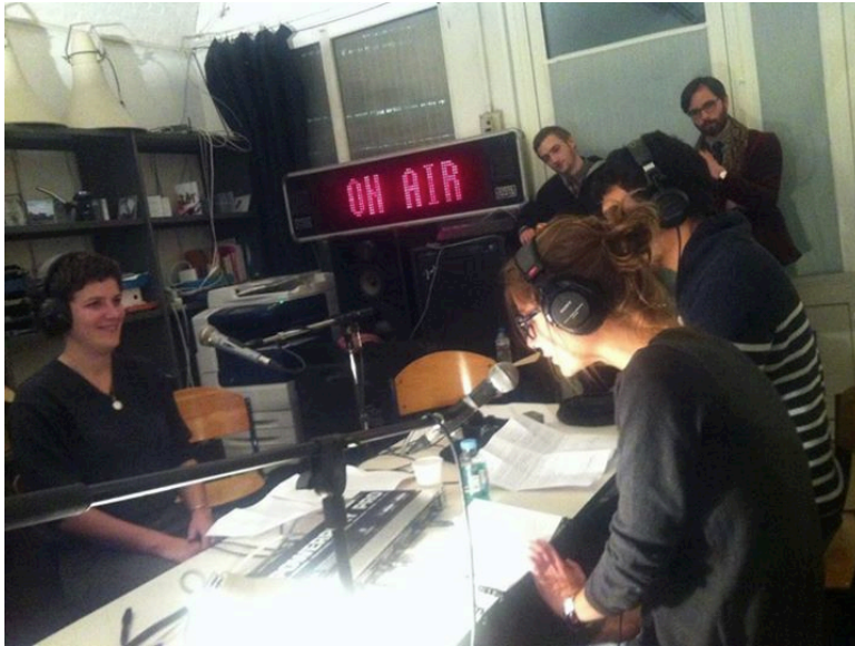
Direct de l'émission de radio PiedNu/ESADHaR , par les étudiants du Master