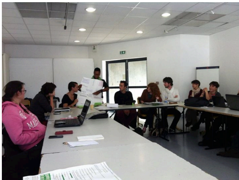
Cours du parcours Création du Master de Lettres et Création Littéraire

Le système universitaire français n'en est plus dépourvu : depuis 2012, le Master de Lettres et de Création Littéraire de l'Université du Havre et de l'École Supérieure d'Art et Design Le Havre-Rouen (ESADHaR) fournit aux étudiants engagés dans une pratique d'écriture les outils pour la développer et la mener à bien, diplôme à la clé.